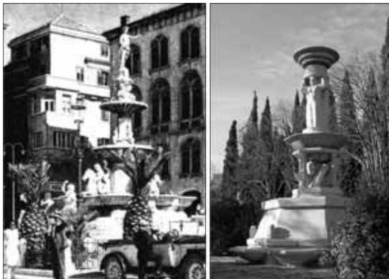
Slučajna sličnost prostorne kompozicije bivše Česme Franje Josipa I (1888.), i "Sunčane Dalmacije" (1989.)?