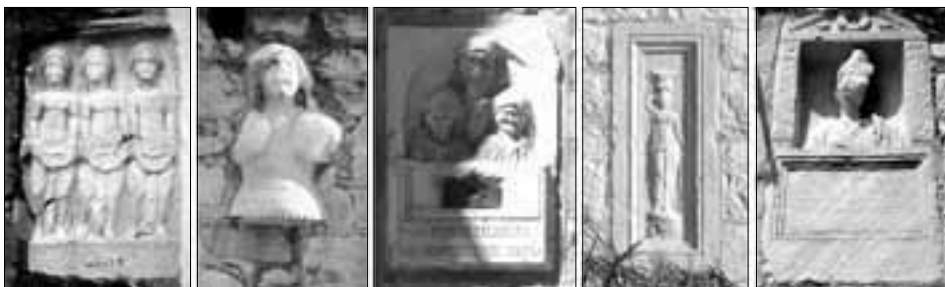
Kameni fragmenti na fasadame kuća u Duplančića dvore,