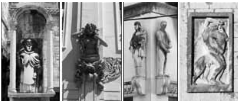
Sveti Ante Opat (1394.), sumporno kupalište (1903.), Radio centar (1933.) i Gimnazija (1940.)