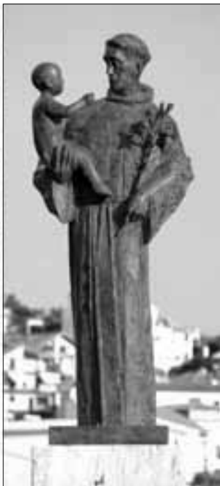
Spliski graničnici: Isus-Krst, spasitelj svieta u Solinu (1900.) i Sveti Ante Padovanski u Podstranu (2006.)