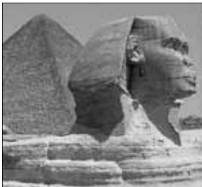
Velika sfinga u Gizehu