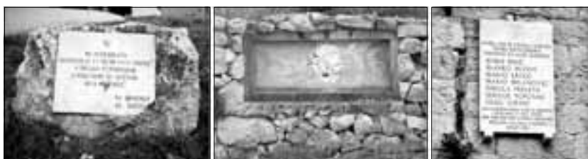
Praksa nažalost demantira pisnika koji piva:- ko na tvrdoj stini svoju povist piše, tom ne može niko prošlost da izbriše...